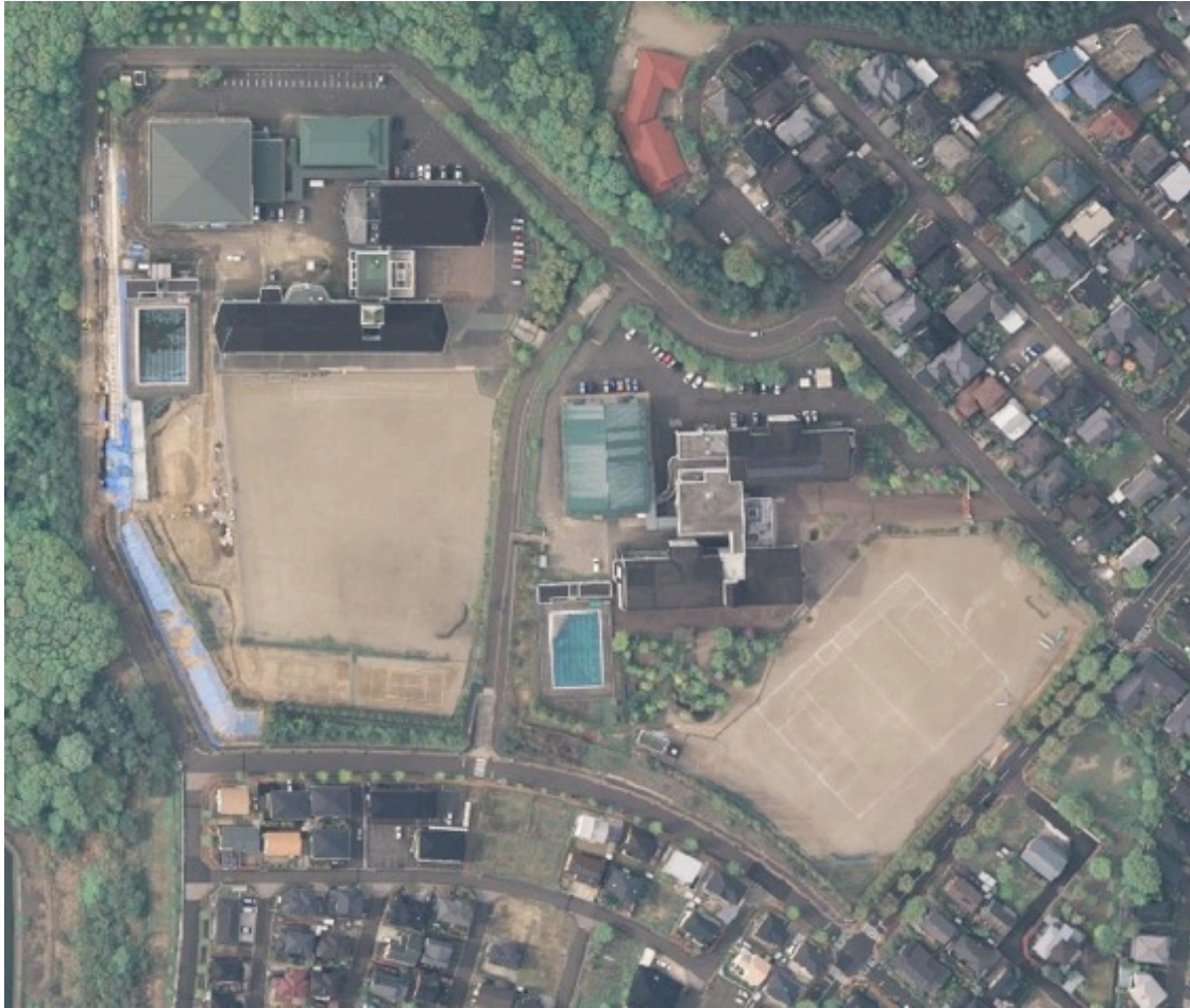
南吉成小・中の駐車場案内