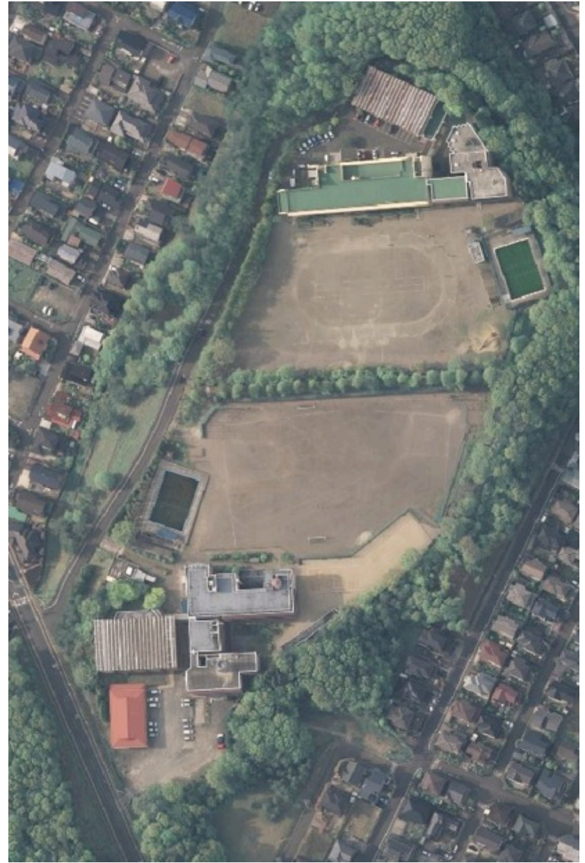
吉成小・中の駐車場案内